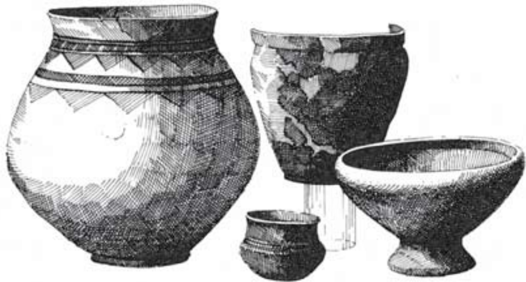
Corredo tombale del periodo Golasecca 1B (fine VIII sec. a.C.)

Purtroppo, la mancanza di dati recenti, verificabili e precisi, impedisce di impostare una ricostruzione più completa, ma sembra ipotizzabile che il territorio galliatese viva, come il resto del Novarese, tra la tarda età del Bronzo e l'età del Bronzo Finale (XIII-X sec. a.C.), il fenomeno generale dello spostamento graduale dell'asse primario delle comunicazioni dalle vie lungo l'Agogna al percorso fluviale del Ticino, con la conseguenza della crescita progressiva dell'importanza di quei centri che potevano rappresentare punti di scalo e di controllo della navigazione, che vedranno passare nell'età del Ferro i commerci intensi e pregiati tra l'Etruria e i centri golasecchiani, verso i principati celtici transalpini.